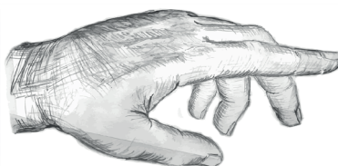
Voie cutanée (peau)